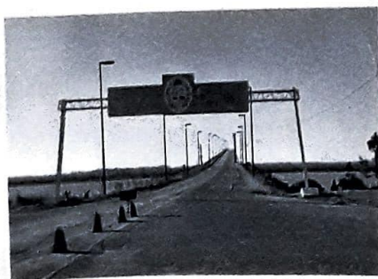
El Estado solo puede exigir el cumplimiento de sus leyes dentro de sus límites territoriales.

Casi todos los Estados del mundo actual son instituciones políticas que ejercen sus funciones sobre un territorio habitado por personas que comparten una identidad nacional, pero existen Estados plurinacionales —como España, Bolivia o China, por ejemplo— o naciones que no tienen su correlato estatal, como el pueblo kurdo que está diseminado por Siria, Irak, Turquía e Irán.