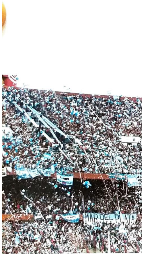
En la Argentina y en muchos países, el fútbol es un factor aglutinante de la nacionalidad.

Es interesante señalar que hacia 1850 se comenzó a utilizar el Estado y Nación que se acaba de analizar. El concepto de Nación utiliza indistintamente ambos términos, lo que no debe ser considerado un error. Si, de acuerdo a las definiciones actuales, debería decir "Nación argentina". Con el paso del tiempo, en el lenguaje cotidiano se consideró que era más importante el Estado y el vocabulario utilizado originalmente.